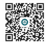
暨南大學本科生招生辦公室官微

37個學院, 58個系, 27個直屬研究院(所), 105個本科專業, 一級學科碩士學位授予點41個、一級學科博士學位授予點26個, 博士後流動站19個。 全日制學生48580人, 其中港澳台僑學生12546人, 外國留學生2075人。 廣州、深圳、珠海三地設有5個校區。